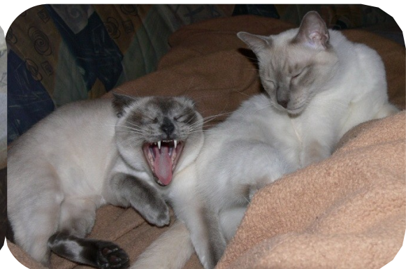
Cheesina und Amethyst - Liebe auf den erste Blick!