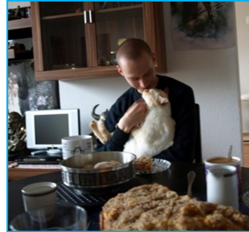
Ich denke dieses Bild spricht für sich!

Ich schreibe hier mal als Mutter eines katzenbegeisterten Sohnes, der kein Mensch großer Worte ist. Alles begann mit meiner Schwester Heike Eibisch, sie verwirklichte sich den Traum einer Thaikatze. Eigentlich braucht man nur den Kontakt zu diesen bezaubernden Tieren und schon ist der Virus übergesprungen.